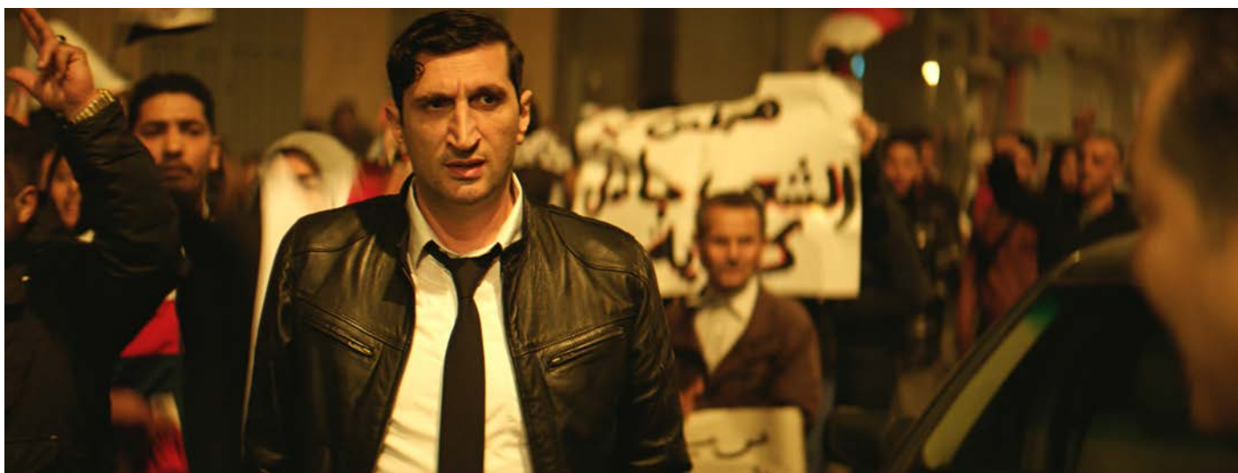
Ovan: Fares Fares i The Nile Hilton Incident. Överst: isländska Heartstone.