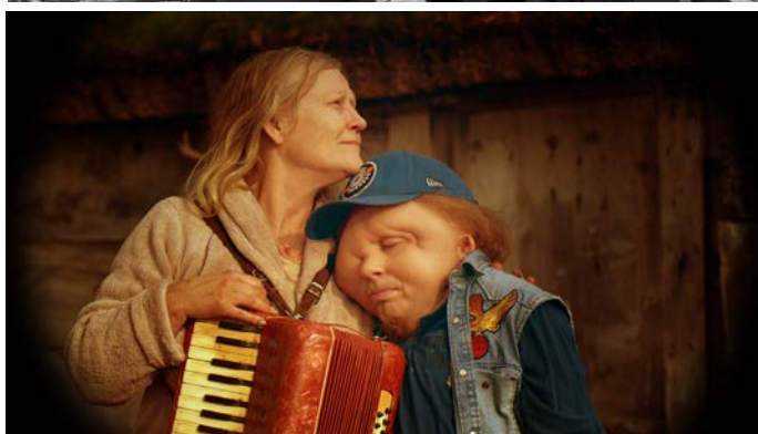
Överst: Frantz (Edge Entertainment), Ovan: Jätten (TriArt), Nedan: Dagen efter denna (Nonstop)